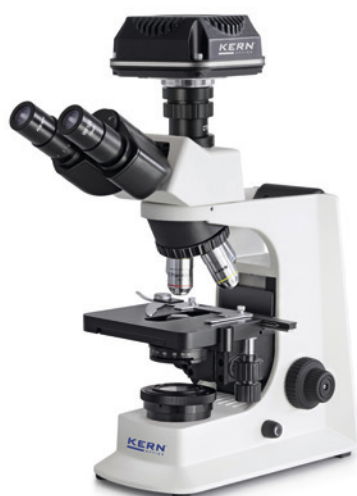
OBL-1 avec caméra