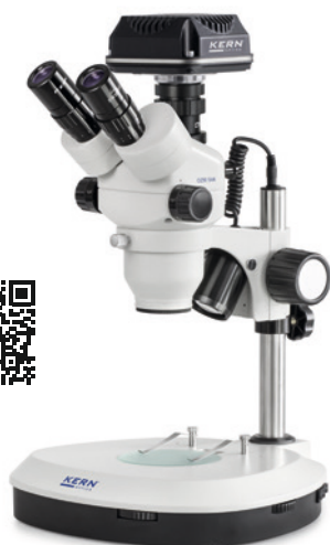
OZM-5 avec caméra