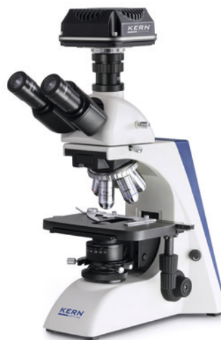
OBN-1 avec caméra