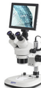
OZL 466 avec tablette