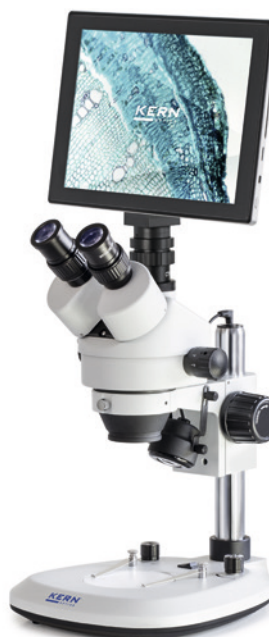
OZL 464 avec tablette