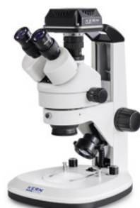
OZL 468 avec caméra