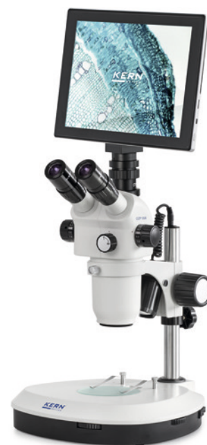
OZP-5 avec tablette