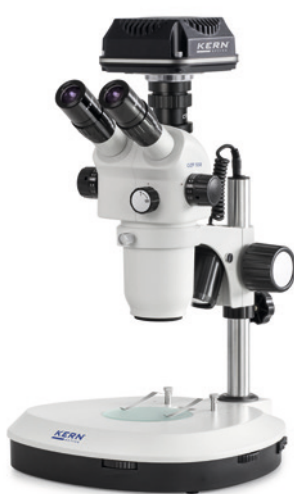
OZP-5 avec caméra