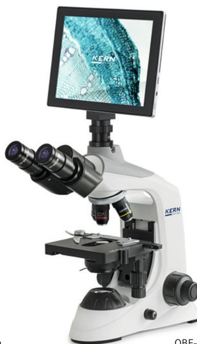
OBE-1 avec tablette