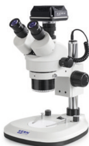
OZL 466 avec caméra