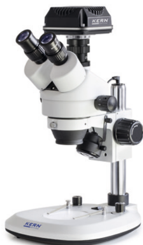
OZL 464 avec caméra