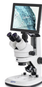
OZL 468 avec tablette