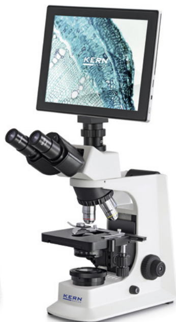
OBL-1 avec tablette