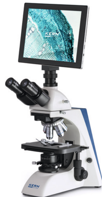
OBN-1 avec tablette