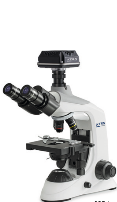
OBE-1 avec caméra