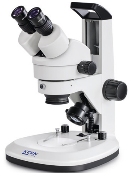
OZL 467 Avec poignée