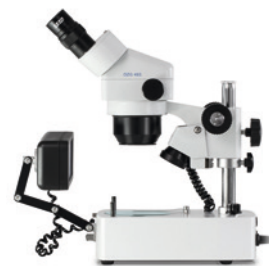
Vue de côté