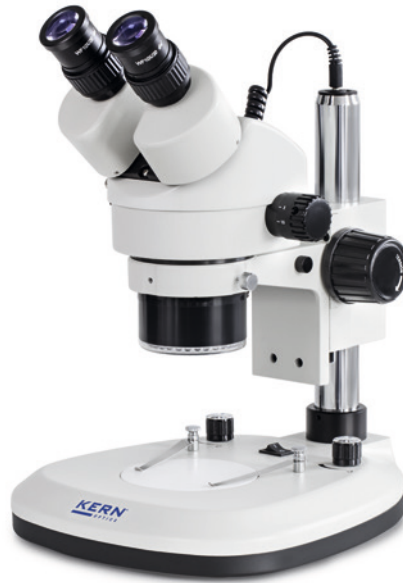
OZL 465 Avec éclairage circulaire