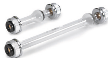
Cuvette 10 et 20 cm