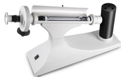
Cuvette dans la chambre de mesure