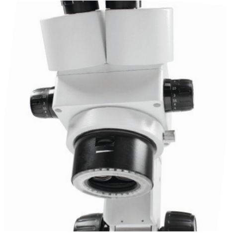
Iluminación de anillos LED integrada, regulable sin escalonamiento