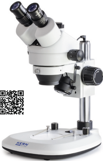
OZL 464 Con caballete estándar