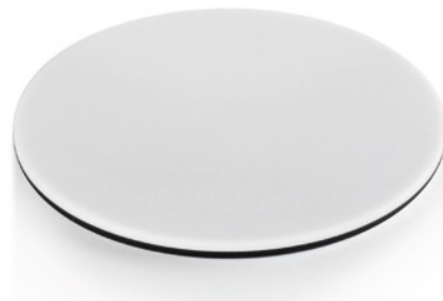
Pieza insertada para caballete blanca