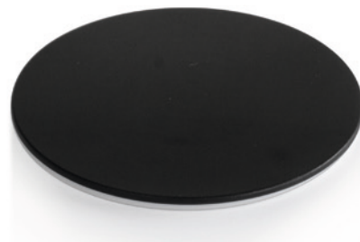
Pieza insertada para caballete negra