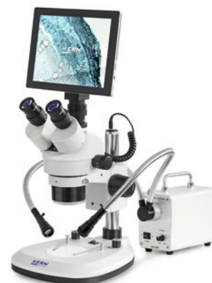
Ejemplo de aplicación